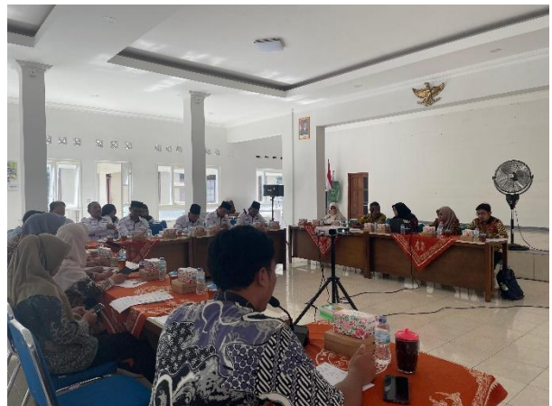
Gambar. Pelaksanaan Pembahasan dan Penetapan Peraturan Kalurahan oleh Pamong Kalurahan , BamusKal dan Kapanewon