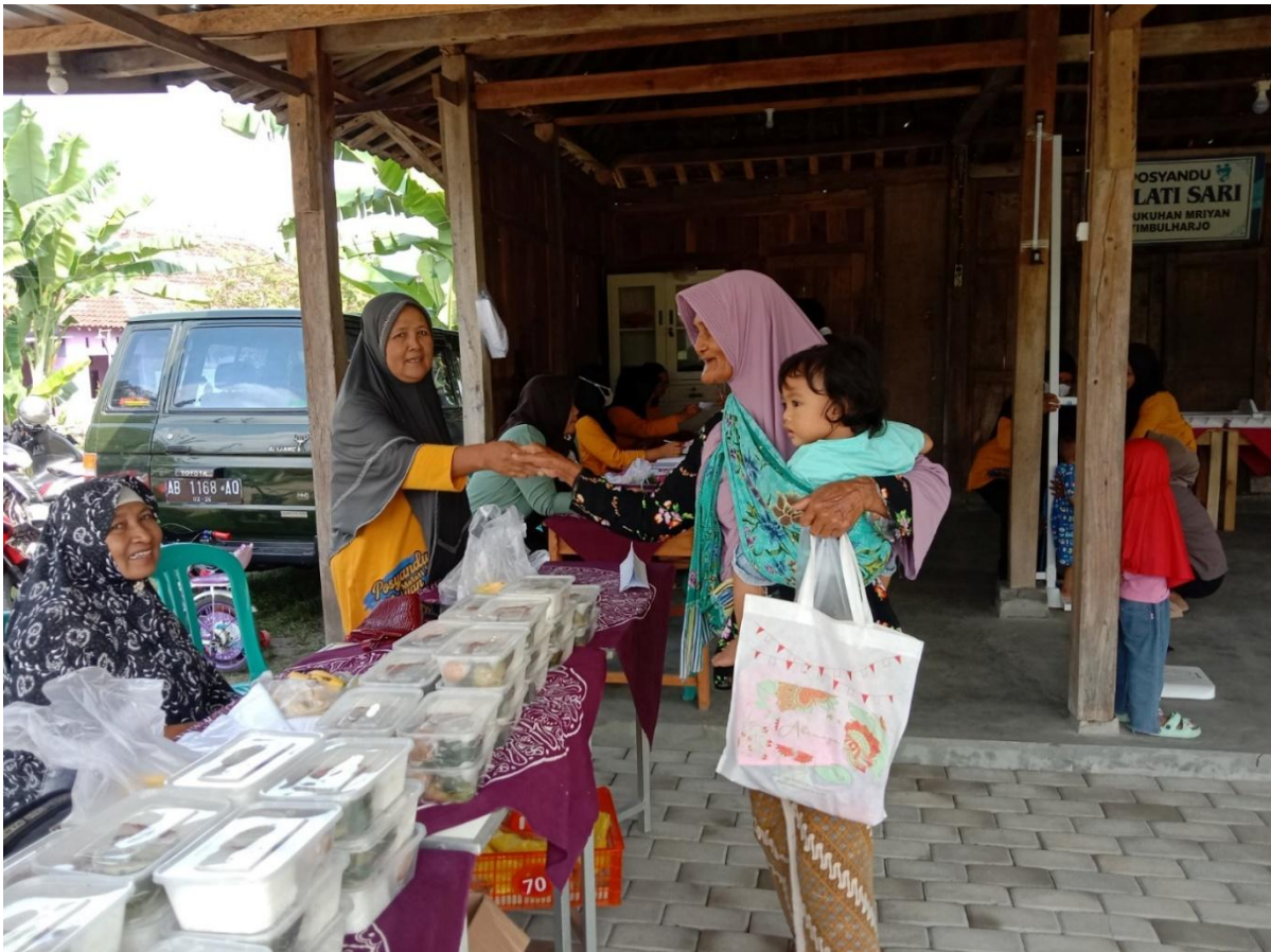
Gambar. Kegiatan Pemberian Makanan Tambahan Untuk Lansia

Bidang pelaksanaan Pembangunan Kalurahan dilaksanakan melalui 2 kegiatan, yaitu kegiatan Non Fisik dan Kegiatan Fisik. Kegiatan pembangunan Non Fisik diwujudkan melalui beberapa kegiatan antara lain Dukungan Penyelenggaraan PAUD, Pengelolaan Pos Kesehatan dan Polindes, Penyelenggaraan Desa Siaga Kesehatan, Fasilitasi Penyelenggaraan Pos Binaan Terpadu (POSBINDU), Pembinaan Kampung KB, Penanganan Gizi Buruk / Stunting, Pendampingan Ibu Hamil Kekurangan Gizi Kronis / Resiko Tinggi Dan Nifas, Gerakan Kebersihan dan Kesehatan Lingkungan (PSN), Pelatihan tentang Lingkungan Hidup dan Kehutanan, & Pelatihan Pengolahan / Pengelolaan Sampah. Salah satu contoh kegiatan di bidang Kesehatan yang langsung dapat dirasakan manfaatnya bagi warga Kalurahan Kalurahan Timbulharjo adalah seperti pendampingan kepada warga terkait Kesehatan dan pemberian makanan tambahan kepada Balita, Lansia, Stunting, Balita Gizi Buruk, Ibu Hamil KEK dengan harapan dapat sedikit membantu atau meringankan beban yang mengalaminya. Dilakukan pendataan oleh kader kemudian ditindak lanjuti dengan langsung mendatangi tempat tinggal yang bersangkutan sebagai bentuk perhatian dari Pemerintah Kalurahan Timbulharjo.