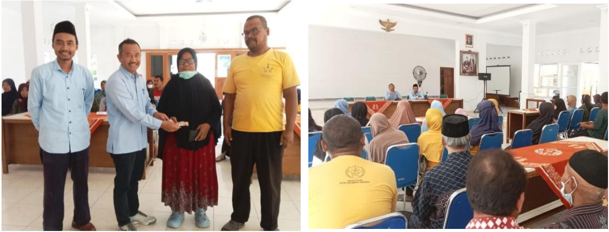
Gambar. Penyerahan Bantuan Langsung Tunai (BLT) Dana Desa Tahun Anggaran 2024 kepada 50 Keluarga penerima Manfaat (KPM)

Demikian Informasi Penyelenggaraan Pemerintahan Kalurahan tahun 2024, kami sampaikan kepada seluruh masyarakat dan warga masyarakat Kalurahan Umbulmartani khususnya, dengan harapan dapat memperoleh tanggapan serta masukan dari masyarakat baik secara lisan maupun tertulis guna meningkatkan kinerja penyelenggaraan Pemerintah Kalurahan Umbulmartani yang lebih baik kedepannya.