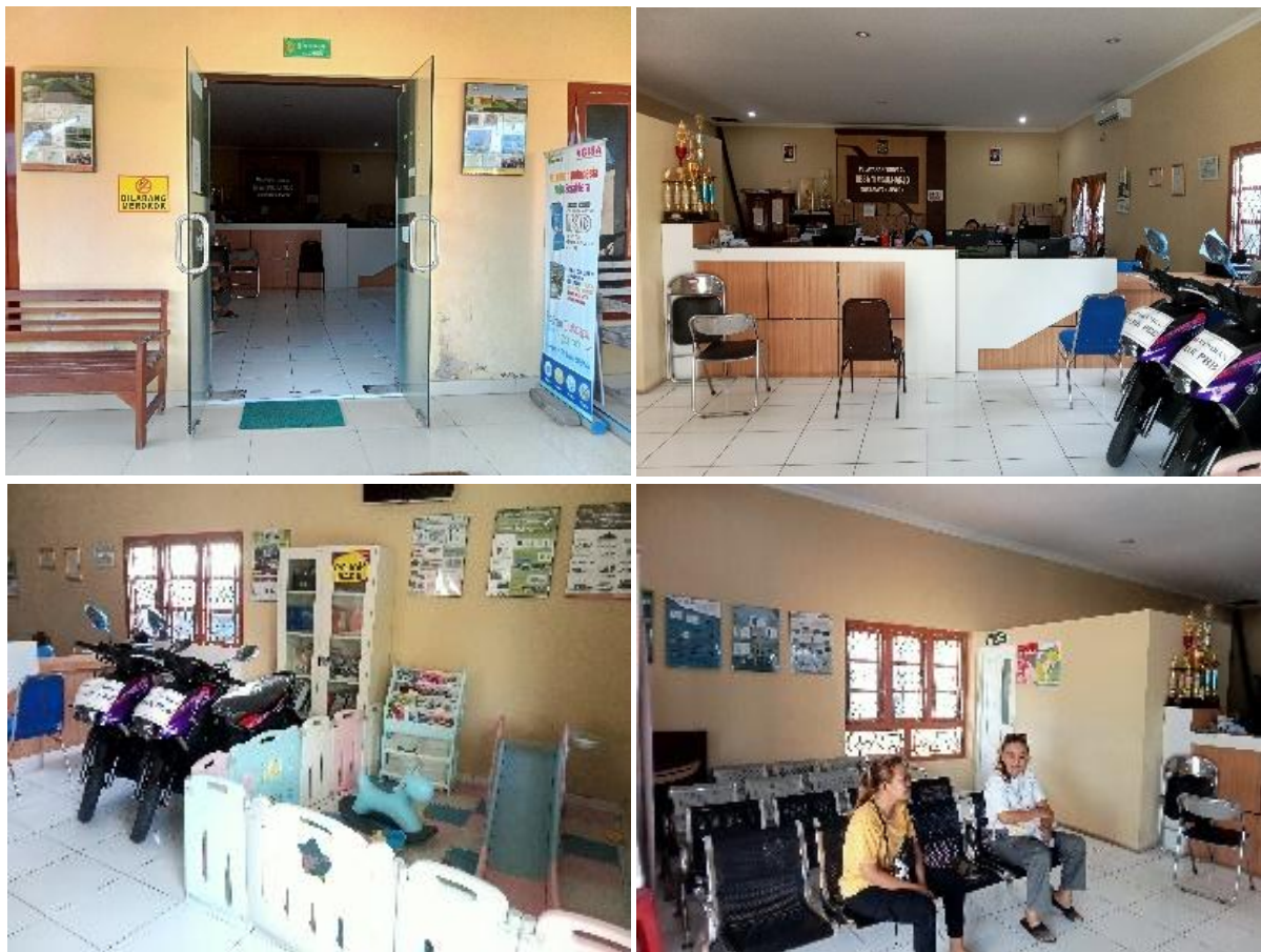
Gambar. Pelayanan di Kalurahan Timbulharjo

Di bidang pelayanan masyarakat. Pemerintah Kalurahan Timbulharjo menerapkan pelayanan dengan 3S (Salam Senyum dan Sapa) dan melakukan terobosan untuk menciptakan pelayanan yang Cepat, Tepat, Akurat dan Tuntas. Untuk proses kepengurusan surat-surat Langkah pertama yang dapat dilakukan membawa surat pengantar dari RT dan Dukuh ke bagian pelayanan Kalurahan Timbulharjo. Dalam proses persuratan di Ruangan tunggu pelayanan Kalurahan Timbulharjo sudah dilengkapi dengan Ruang Baca, Ruang Bermain layak anak, Ruang Laktasi bagi ibu menyusui dengan ruangan berAC.