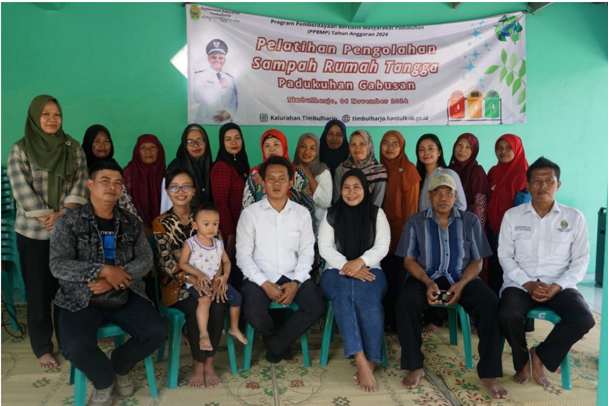
Gambar. Pelatihan Pengelolaan Sampah Rumah Tangga Padukuhan Gabusan

Kalurahan Timbulharjo juga memberikan fasilitasi baik berupa kegiatan pertemuan atau koordinasi dan fasilitasi lain untuk menunjang tim/kader dalam menjalankan program kerjanya.