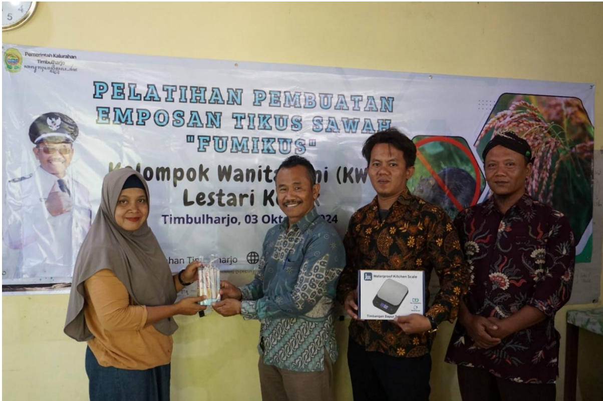
Gambar. Pelatihan Pembuatan Emposan Tikus Sawah KWT Lestari Kepek

pemberdayaan masyarakat yang ada di Kalurahan. Program Kerja Bidang Pemberdayaan Masyarakat Kalurahan dikelompokkan menjadi sub kegiatan pemberdayaan yaitu Bidang Pertanian dan Peternakan, Bidang Pemberdayaan Perempuan, Perlindungan Anak dan Keluarga, Bidang Koperasi, Usaha Mikro Kecil dan Menengah (UMKM), Bidang Dukungan Penanaman Modal, dan Bidang Perdagangan dan Perindustrian. Bentuk kegiatan yang dilaksanakan meliputi pelatihan/workshop, penyelenggaraan kegiatan, peningkatan sarana/prasarana, pengembangan usaha, dukungan modal, dan pembinaan serta penyuluhan kepada masyarakat .