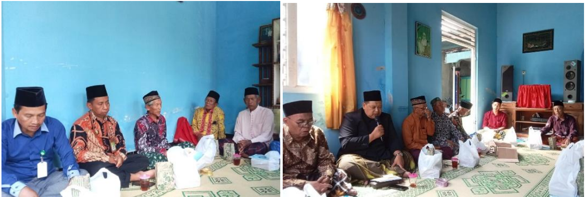
Gambar. Pembinaan Rois Sabilillah Timbulharjo Tahun 2024

Disamping kegiatan kegiatan diatas, Pemerintah Kalurahan Umbulmartani melaksanakan beberapa kegiatan yang berkaitan dengan keagamaan. Salah satunya adalah Kegiatan bagi Pengurus Tempat Ibadah, Pengajar Agama Non Formal Desa, Tokoh Agama (ROIS).