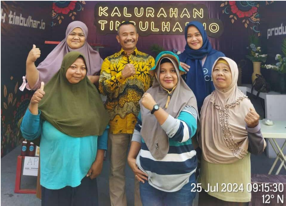
Gambar. Partisipasi UMKM Timbulharjo dalam Bantul Creative Expo

Khusus (BKK), Alokasi Dana Desa (ADD), Bagi Hasil Pajak (PBH), dan sumber lainnya. Anggaran tersebut diwujudkan kegiatan Pelatihan Kelompok Pertanian, Fasilitas Pertemuan Kelompok Pertanian, Fasilitas Angkat Walet, Fasilitas Pengendalian Hama, Pembuatan Rubuha, Rehabilitasi Saluran Irigasi Tersier, Fasilitas Pertemuan Kelompok Desa Prima, Fasilitas Pertemuan Kelompok Desa Preneur, Pelatihan Peluang Usaha Bagi Difabel, Pendataan dan Updating Data Difabel, Workshop Ketahanan Keluarga, Fasilitas Bantul Expo, Fasilitas BUMKal Timbul Sejahtera, Pembuatan Pintu Pasar Unggas, Rehabilitasi Los Pasar Kalurahan, & Pembangunan Pasar Kuliner Timbulharjo. Realisasi Bidang Pemberdayaan Masyarakat Kalurahan adalah sejumlah Rp. 649.074.400,- (Enam Ratus Empat Puluh Sembilan Juta Tujuh Puluh Empat Ribu Empat Ratus Rupiah) atau dengan persentase mencapai 96,16%.