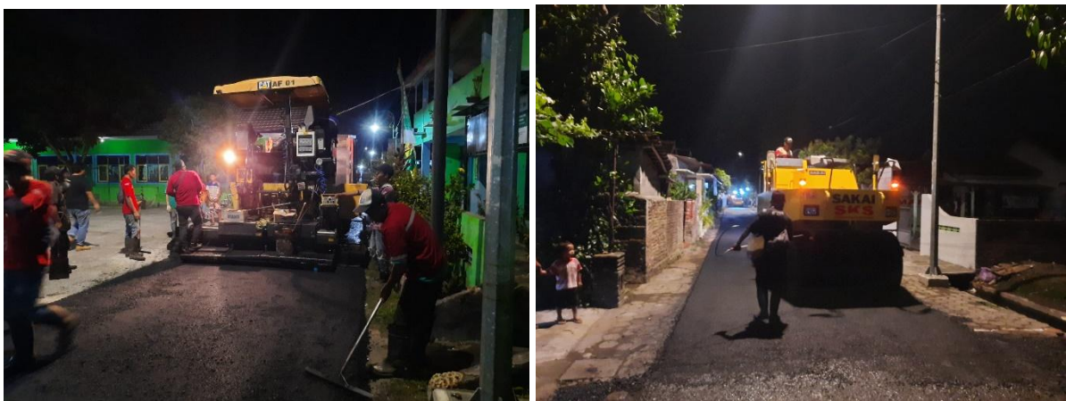
Gambar. Pembangunan Aspal Jalan Bibis

Selain kegiatan pembangunan Non Fisik, Pemerintah Kalurahan Timbulharjo juga melakukan kegiatan Pembangunan Fisik, baik yang bersumber dari Dana Desa (DD), Bantuan Keuangan Khusus (BKK) Kabupaten dan Bantuan Keuangan Khusus (BKK) PPBMP. Kegiatan Pembangunan Fisik terdiri dari beberapa kegiatan yang langsung bersasaran ke beberapa Padukuhan atau pembangunan di masing-masing padukuhan antara lain Pembangunan/Rehabilitasi Gedung PAUD/TK, Pembangunan Gedung Serbaguna, Rehabilitasi Rumah Tidak Layak Huni (RTLH), Pembangunan Aspal Jalan, Pembangunan Corblok Jalan, Pembangunan Talud Irigasi, Penerangan Jalan Umum Kampung, Pengadaan Sarana Pedidikan PAUD, Pengadaan Sarana Kesehatan Posyandu, Pengadaan Sarana Prasarana Persampahan & Pengadaan Bibit Pohon .