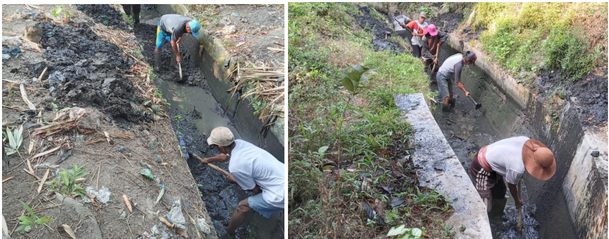
Gambar. Gotong Royong Angkat Walet Saluran Irigasi

Dalam rangka mewujudkan kemampuan dan kemandirian masyarakat di Kalurahan Timbulharjo, maka Pemerintah Kalurahan Timbulharjo melaksanakan Program Pemberdayaan Masyarakat Kalurahan. Program kerja tersebut merupakan upaya untuk meningkatkan pengetahuan, sikap, keterampilan, kemampuan, serta kesadaran memanfaatkan sumber daya melalui penetapan kebijakan, program, kegiatan, dan pendampingan yang sesuai dengan esensi masalah dan prioritas kebutuhan masyarakat Kalurahan. Strategi pemberdayaan Masyarakat Kalurahan didasarkan pada pengembangan ekonomi Kalurahan, Peningkatan Kapasitas Masyarakat, Penguatan Lembaga Kalurahan, Peningkatan akses terhadap inovasi, informasi dan teknologi, dan penggalian potensi yang dimiliki Masyarakat Kalurahan.